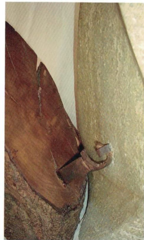
WOOD, ALABASTER & HOOK