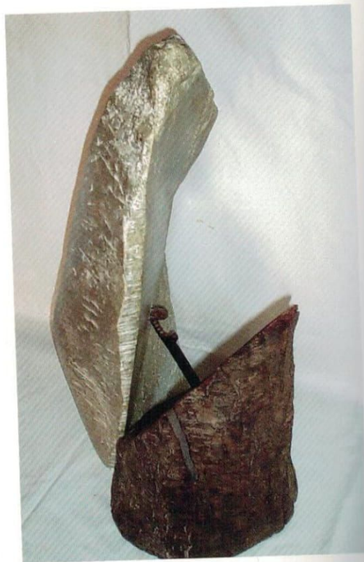
CONNECTION - FOUR VIEWS