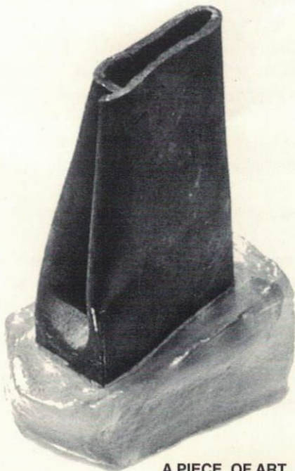
אובייקט אמנותי A PIECE OF ART ברזל, פוליסטר IRON, POLYESTER