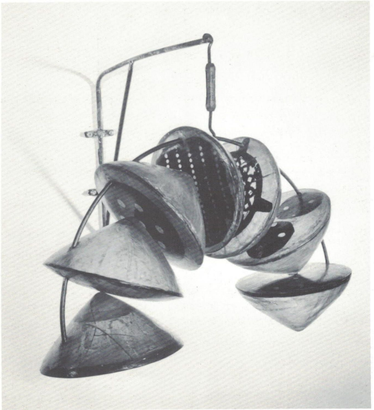
SIEVES OF LIGHT