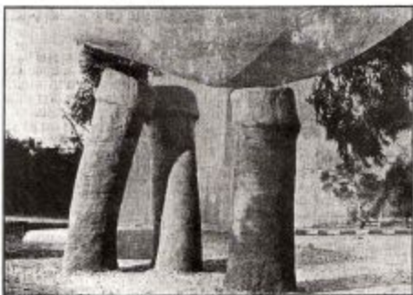
מבנים בעקבות טרמיטיים: מפגש עם גזרות כמכר ורומים פאלים